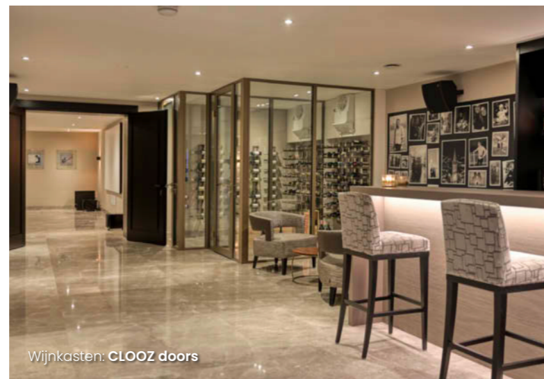
Wijnkasten: CLOOZ doors